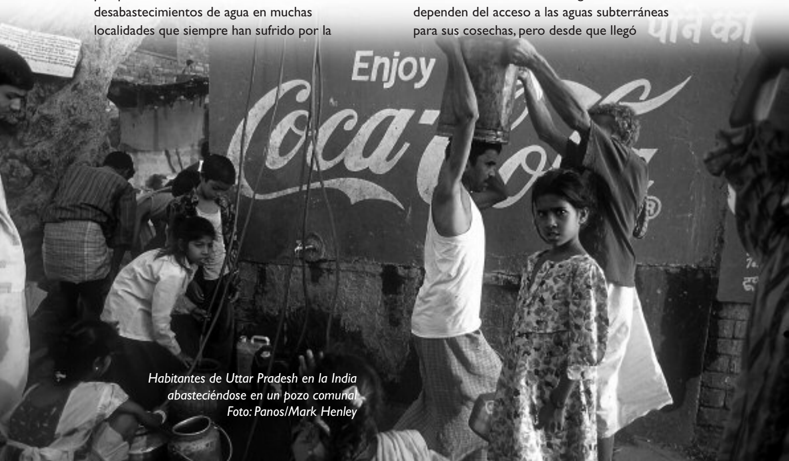
Habitantes de Uttar Pradesh en la India abasteciéndose en un pozo comunal

Coca-Cola abrió una planta embotelladora en el pueblo de Kaladera en Rajastán a finales de 1999. Rajastán es conocido como el estado desierto y Kaladera es un pueblo pequeño y empobrecido que se caracteriza por sus condiciones semiáridas. Los agricultores dependen del acceso a las aguas subterráneas para sus cosechas, pero desde que llegó